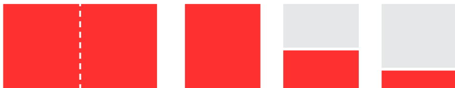
S101V 450 x 285 mm