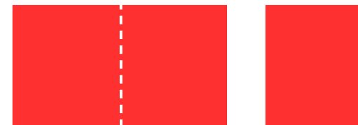
S101V 440 x 280 mm