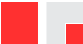
D101V 230 X 295 mm