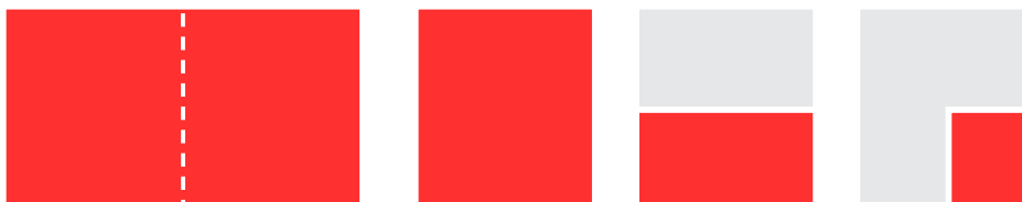
S101V 460 x 290 mm